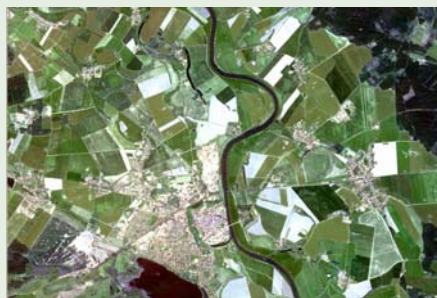
RapidEye: 13.04.2009, RGB-Darstellung, Auflösung 5 m

werden können. RapidEye bietet mit seinem System aus fünf baugleichen sonnen-synchronen Satelliten die Möglichkeit, großflächige Gebiete mit hoher zeitlicher Frequenz zu erfassen. TerraSAR-X als neuer deutscher Radarsatellit bietet wolkenunabhängig hochauflösende Informationen bezüglich der Erdoberfläche, die gezielt in die Entwicklung von Change Detection Verfahren einfließen sollen.