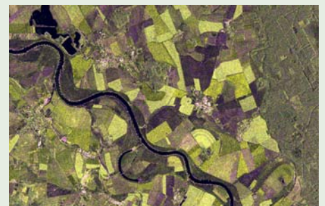
TerraSAR-X: 10.04.2009, Stripmap HH-VV, Auflösung 3 m