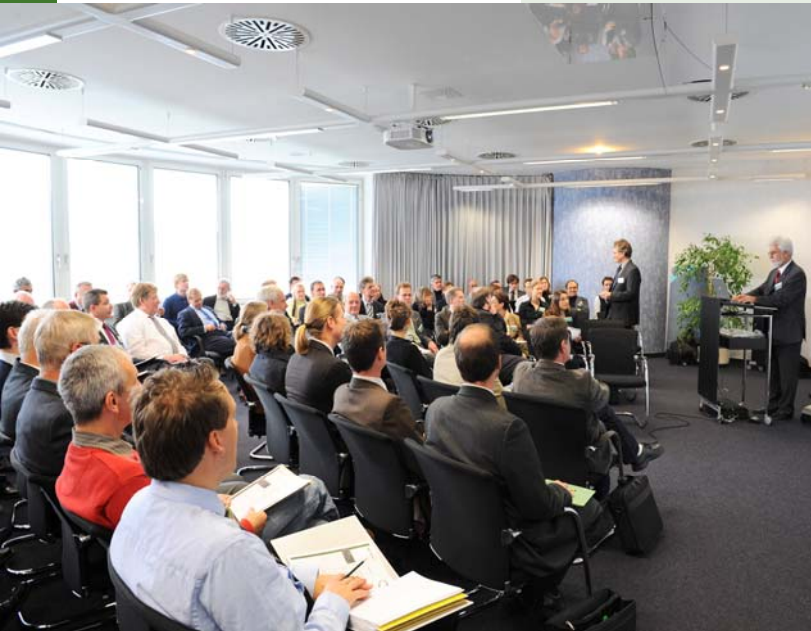
Auditorium des Nutzerworkshops im Sitzungssaal des DLR

Über 70 Teilnehmer aus Fachbehörden des Naturschutzes von Bund und Ländern