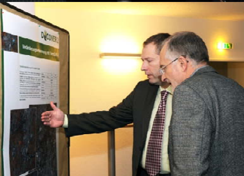
Der Nutzerworkshop bot die Möglichkeit zur Kontaktpflege und zum fachlichen Austausch